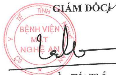
Trần Tất Thắng