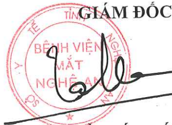
Trần Tất Thắng