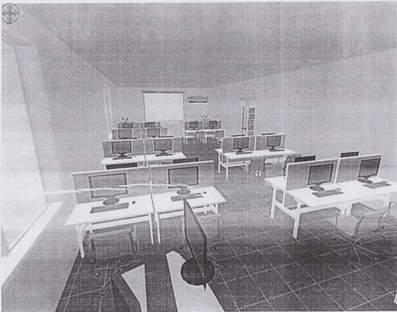
PHỐI CẢNH PHÒNG KHAI THÁC CSDL - TRƯỜNG ĐẠI HỌC VINH