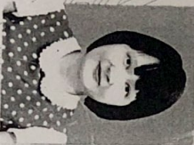
Award holder's signature