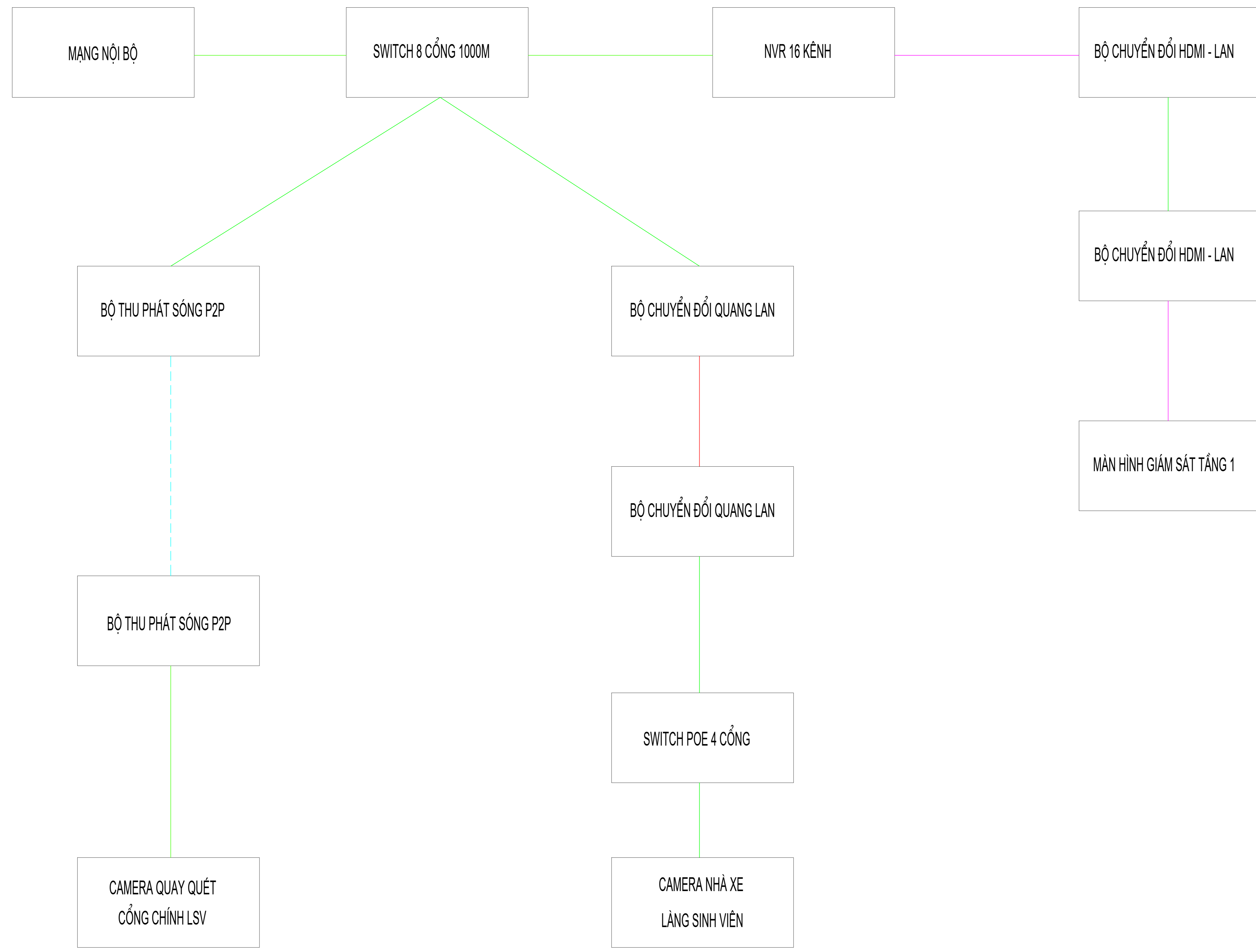
SƠ ĐỒ NGUYÊN LÝ CAMERA GIÁM SÁT CỔNG VÀ NHÀ XE LÀNG SINH VIÊN