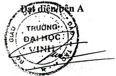
Trần Tất Thắng