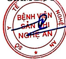
TS.BSCKII. Tăng Xuân Hải